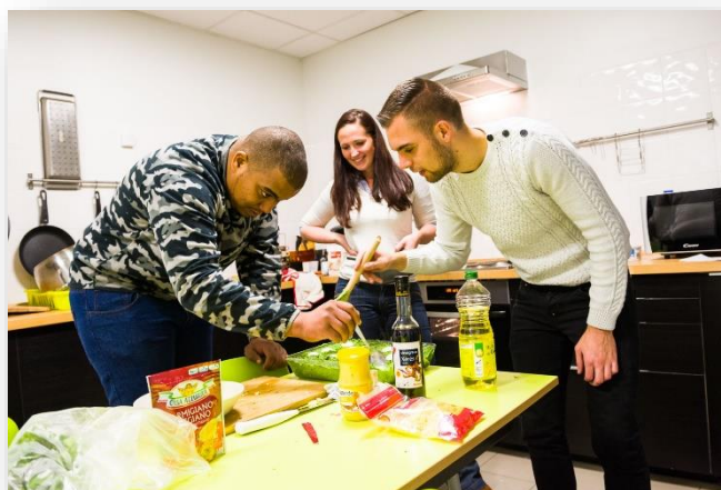
Résidents du FJT Moissy Cramayel, Association Relais Jeunes 77